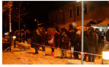
Numeroso il pubblico nonostante la neve