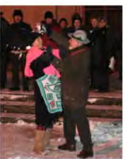
Il falò davanti alla chiesa di S. Patrizio. Più a fianco il coro e a sinistra la scenetta di 'Mariano e Marianna'

PIZZIGHETTONE — A rievocare la tradizione contadina dei giorni più freddi dell'anno, con i canti della Merla, è stata anche la comunità regognese, mercoledì sera, sul sagrato della chiesa parrocchiale di San Patrizio. La serata, organizzata dal club 'Amici